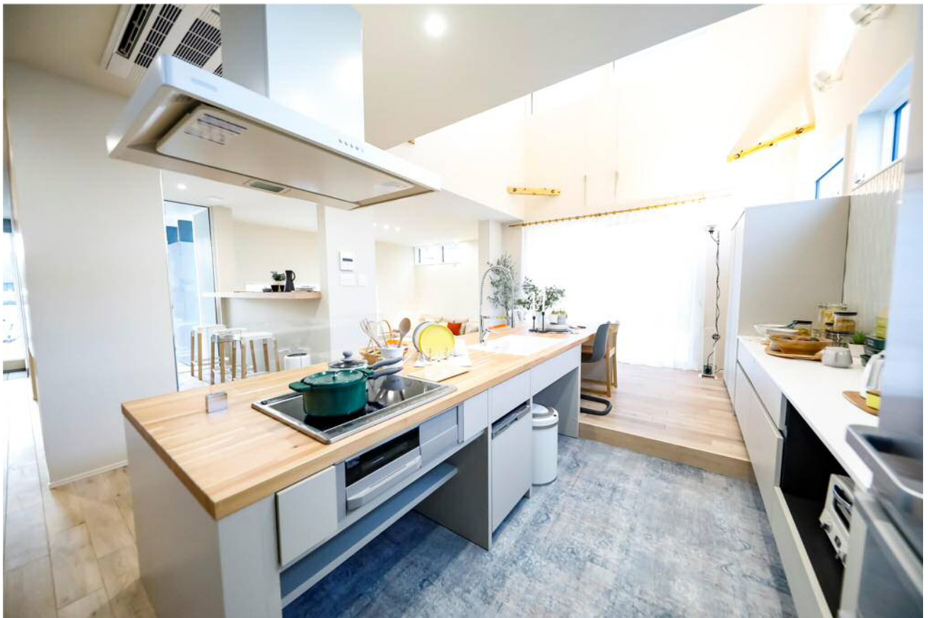
(写真は 2022 年 1 月に新規出店した「Afternoon Tea HOUSE リブワーク千葉店」)