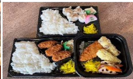
お弁当 各種 390円～