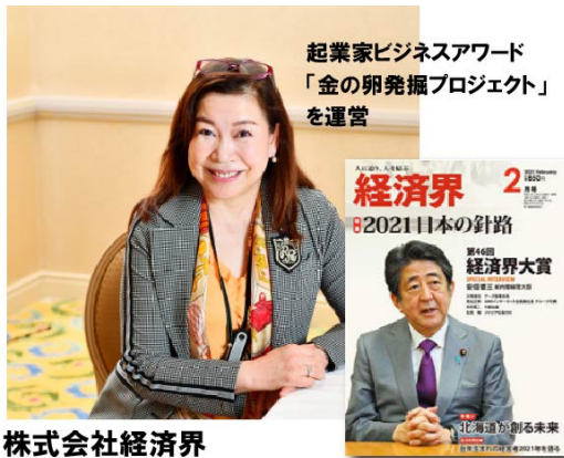
株式会社経済界 代表取締役社長