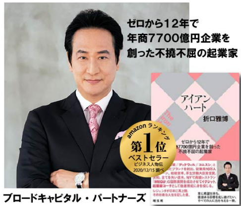
ブロードキャピタル・パートナーズ CEO