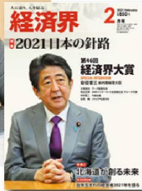
北海道が創る未来