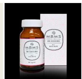
健康食品及びサプリメント