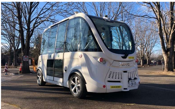
自動運転バス ARMA（アルマ）