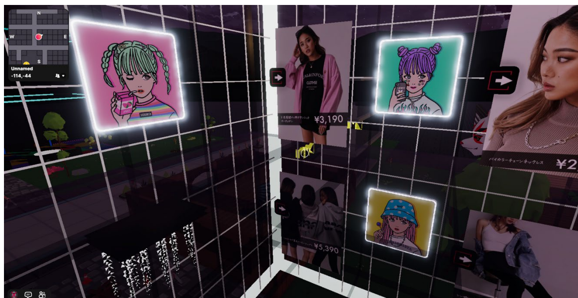
ANAP meta store 店 NFT 展示内容