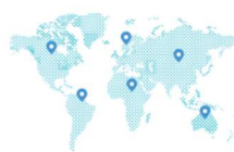
多言語対応 20カ国語に対応