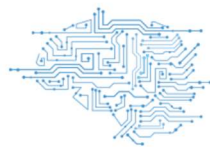
自然言語理解 最先端の機械学習を搭載