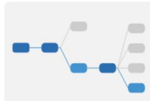
GUIエディタ 短期時間での構築が可能