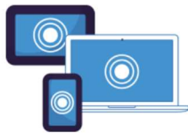
マルチインターフェイス 様々なアプリ/デバイスと接続可能