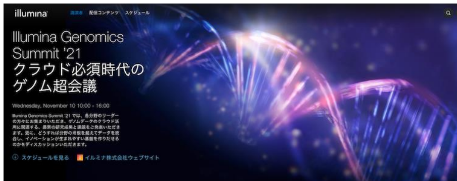
< 「Touchcast」で実施されたイルミナの社の大規模イベントページ >