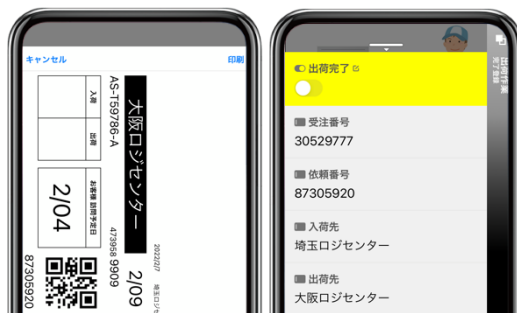
入荷～出荷までの作業管理やラベル印刷操作をアプリひとつで実現