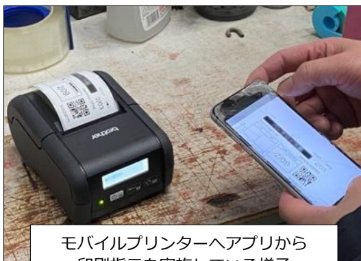
モバイルプリンターへアプリから印刷指示を実施している様子

コロナ禍における外出自粛等により EC 市場が大幅に拡大 *2 するなか、運輸業のコネクストは、急増する取扱量に迅速に対応するため、新たな中間拠点として「通過型物流センター」を半年間で立ち上げることにしました。しかし、既に全社に導入していた基幹システムは、機能の改修には外部のエンジニアによる開発工数や相応のコストがかかることから、新設する物流センターの現場業務に合わせたシステム構築を半年間で完了させることは困難な状況でした。