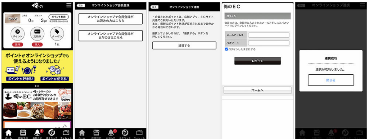
図1 『俺のアプリ』と『俺の EC』の連携画面

ポイントの共通化により、店舗利用で貯めたポイントをネットショップで使用したり、ネットショップで貯めたポイントを店舗で利用可能なクーポンに引き換えることができるなど、顧客接点の拡大が期待されます。