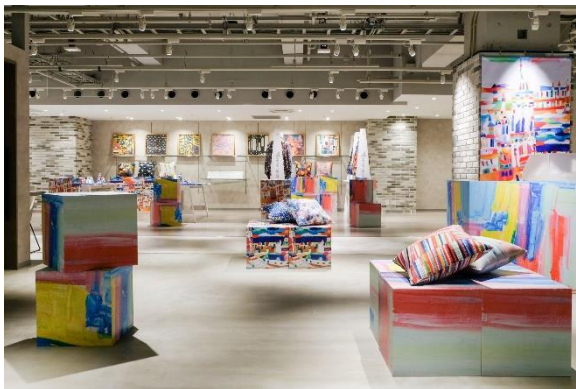
「HERALBONY CARAVAN in 渋谷」

また、FABRIC TOKYO の隣接区画には、インクルーシブな取り組みを発信するイベントスペース（カレンダーリウム）を新設し、第 1 弾として「HERALBONY CARAVAN in 渋谷」を期間限定でオープン。同空間を“異彩”のアートが鮮やかに彩り、ヘラルボニーエポスカードをはじめ、作品をデザインに起用したアートプロダクトの販売をおこないます。また、世界ダウン症の日・世界自閉症啓発デーの連動企画としてフォトブースの設置なども行う予定です。