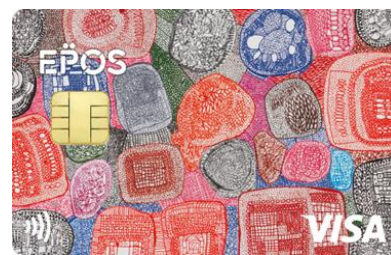
ヘラルボニーエポスカード

2021年2月に当社グループが開催したピッチイベント、第1回「Marui Co-Creation Pitch」にて、優秀賞、オーディエンス賞をダブル受賞し、11月より、ヘラルボニーが契約する作家により描かれたデザインの提携クレジットカード、『使うたび、社会を前進させる。『ヘラルボニーエポスカード』』を発行しています。