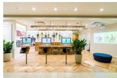
新宿マルイ 本館の店舗

“Fit Your Life.”をブランドコンセプトに、体型だけでなく、お客さま一人ひとりの価値観やライフスタイルにフィットする、オーダーメイドのビジネスウェアを提供するブランドです。一度、ご来店いただき、店舗で採寸した体型データがクラウドに保存されることで、以降はオンラインからオーダーメイドの1着を気軽に注文することができます。リアル店舗も自社で展開し、関東・関西・名古屋・福岡で合計 14 店舗を運営中。