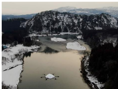
阿賀野川上空を飛行する ACSL とエアロネクストの物流専用ドローン（阿賀町鹿瀬地区）