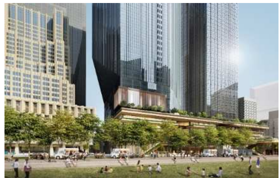
日比谷公園から街区を臨む(イメージ)