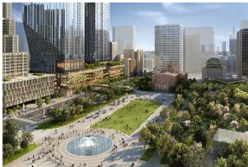
街区と日比谷公園をつなぐ道路上空公園(イメージ)