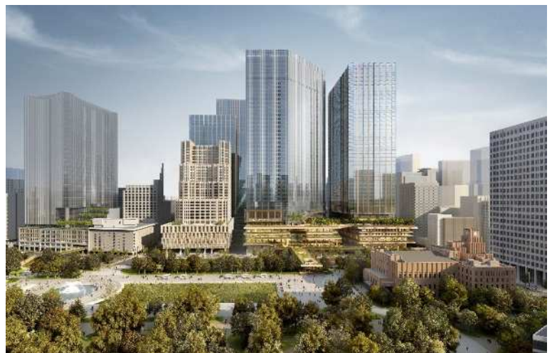
内幸町一丁目街区完成イメージ