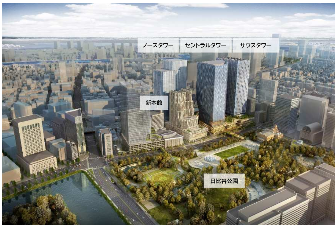
内幸町一丁目街区完成イメージ

街の価値を最大化するため、当街区のマスターデザイン・空間づくりには、ロンドンを拠点に活動する PLP アーキテクトチャーを起用し、当街区の特性である 6.5ha もの広大な敷地、帝国ホテル新本館と 3 棟の超高層タワーが織りなすスケール感、日比谷公園に隣接する立地を最大限に活かします。日比谷公園の緑と水、アクティビティの可能性を広げる多様なパブリックスペースが計画された、街としての個性と調和が共存したデザインとしています。