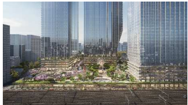
銀座側から2haの大規模広場を臨む(イメージ)