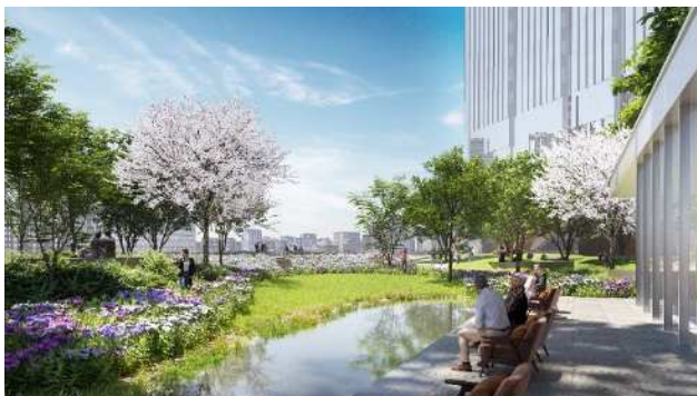
31m 基壇部上広場(イメージ)

※「カーボンマイナス」とは、CO 2 排出量実質ゼロに加え、CO 2 を吸収する技術等の導入により、当街区にて排出される電気・熱エネルギーの CO 2 排出量を実質マイナスとするもの。