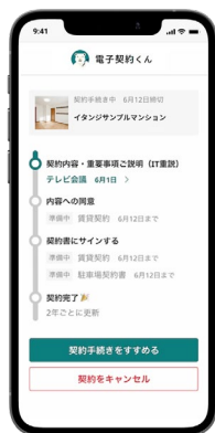
「電子契約くん」入居者 利用画面イメージ