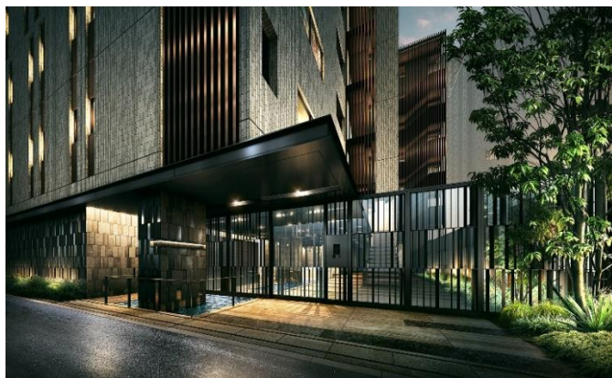
エントランス完成予想図（※8）