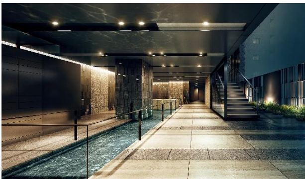
エントランスホール完成予想図 (※8)