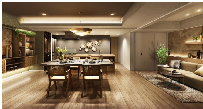
リビングダイニング完成予想図（Aタイプ）(※16)