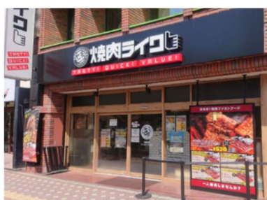
大宮西口店【第2号店】