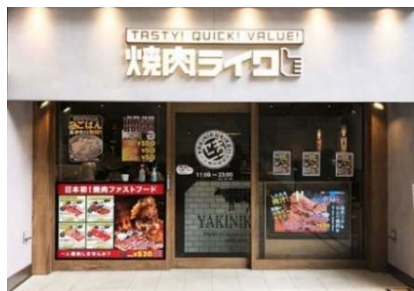
目黒東口店【当社グループ 第1号店】