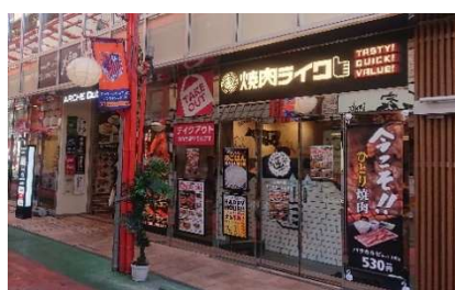
大宮東口店【第4号店】