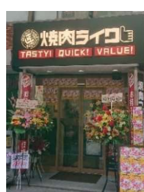
吉祥寺南口店【第3号店】