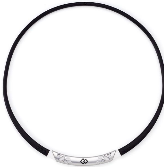
ブラック×ホワイト