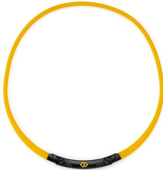
イエロー×ブラック