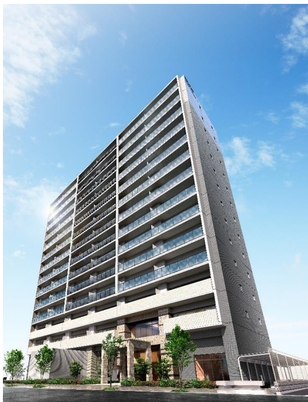
< 外観 (フォレスト) >