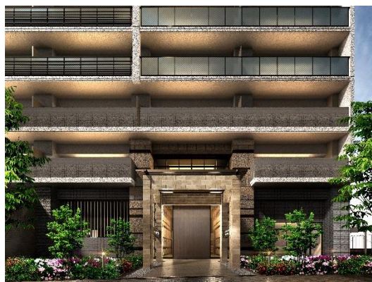
< アプローチ (フォレスト) >