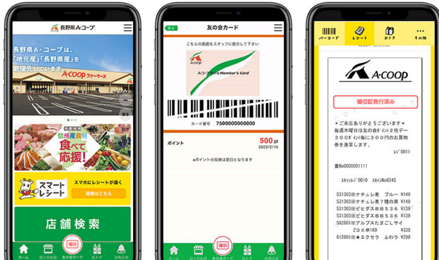
図2 『長野県 A・コープ公式アプリ』トップページ/会員証/スマートレシート画面

『betrend CSdelight 連携プラン』の導入により、アプリ会員証を中心としたポイント管理および情報配信と購買データを活用した顧客分析とプロモーション施策を実現しています。また、東芝テックが提供する『スマートレシート』もあわせて導入することで、アプリに電子レシート機能を追加しており、アプリの利便性を向上させています。