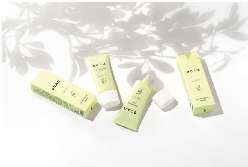
「B.C.A.D. UV プロテクションクリーム a」商品イメージ

『B.C.A.D.（ビーシーエーディー）』は、肌そのものが持っている自己美肌力※ 4 に着目した、素肌を美しく目覚めさせる、働くプロフェッショナルのためのスキンケアブランドです。