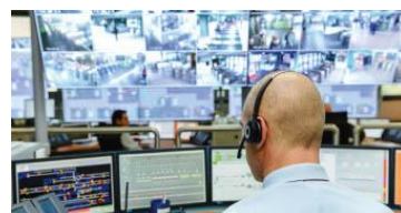
駐車情報管理マネジメント