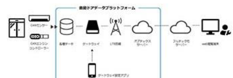
自動ドア連携情報配信サービス