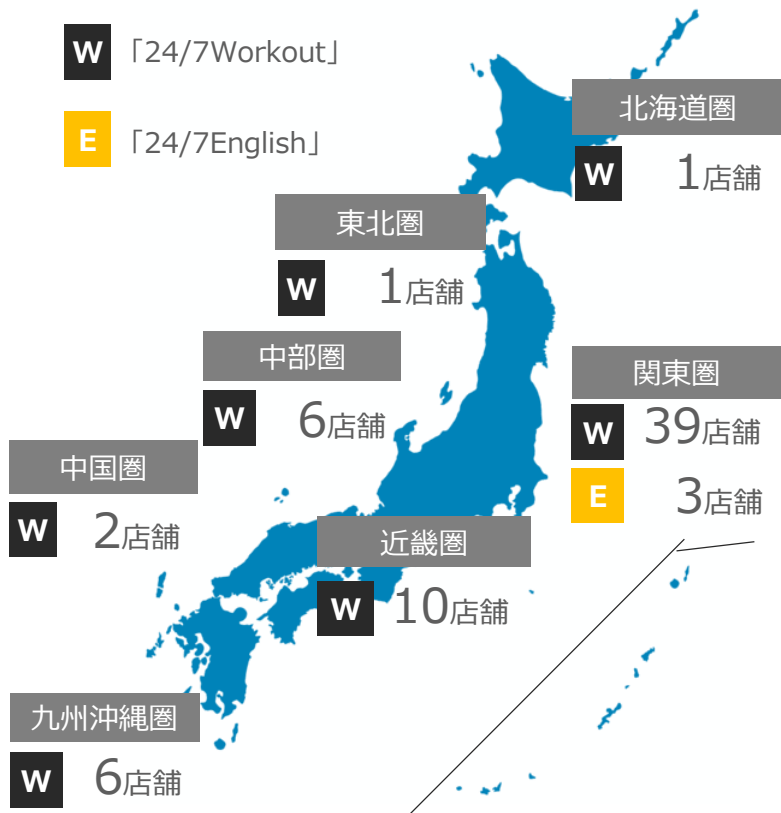
現在の地域別国内店舗網