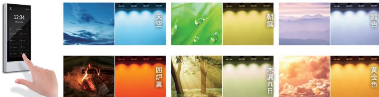
※遠藤照明「次世代調光調色シリーズ Synca（シンカ）」商品説明より

導入設備：「次世代調光調色シリーズ Synca」「無線調光システム Smart LEDZ」