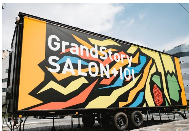
「GrandStory SALON+ 101」外観

※工場にて製造されたボックス型の「ユニット」を用い、目的や環境に応じた店舗空間を提供するサロン