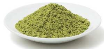
石垣島ユーグレナ粉末