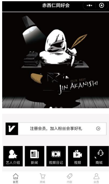
ファンサイトトップ