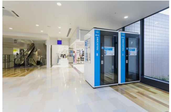
オフィスビル・商業施設内のテレキューブイメージ