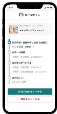
「電子契約くん」入居者 利用画面イメージ