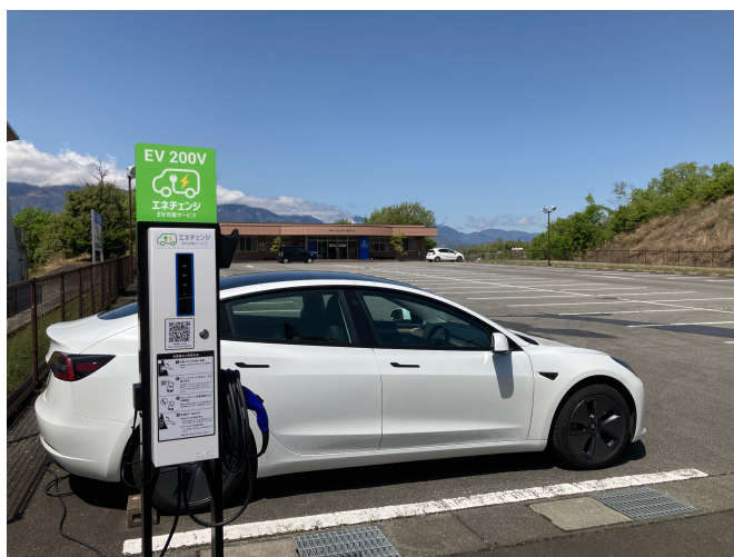
ジットセレモニー双葉ホール