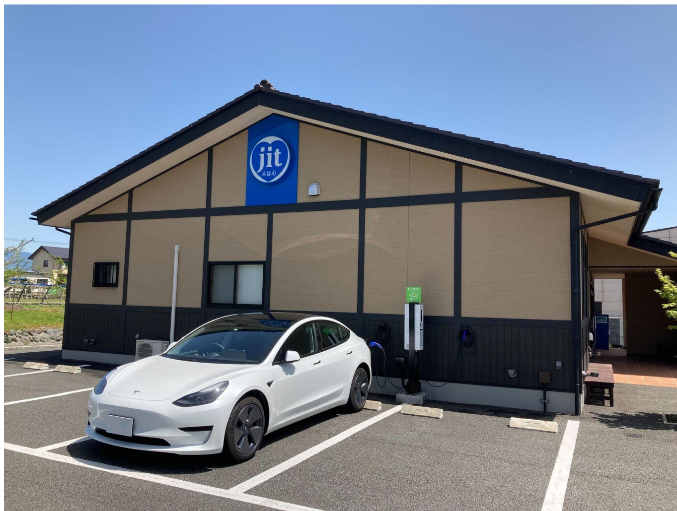
ジットセレモニー若草ホールに設置されたエネチェンジEV充電サービスの充電スタンド

※東京電力従量電灯Aの電力量料金3段階目に再生可能エネルギー発電促進賦課金、燃料費調整額を加算した1kWhあたりの料金