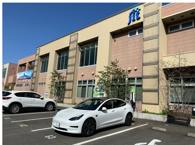
ジットグループ本社