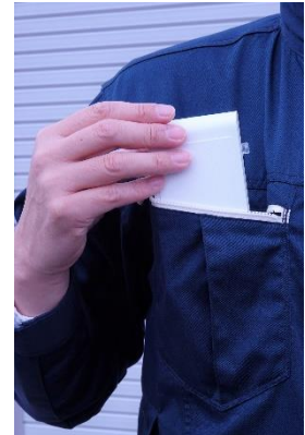
オールインワンながら 設置性に優れる コンパクト設計