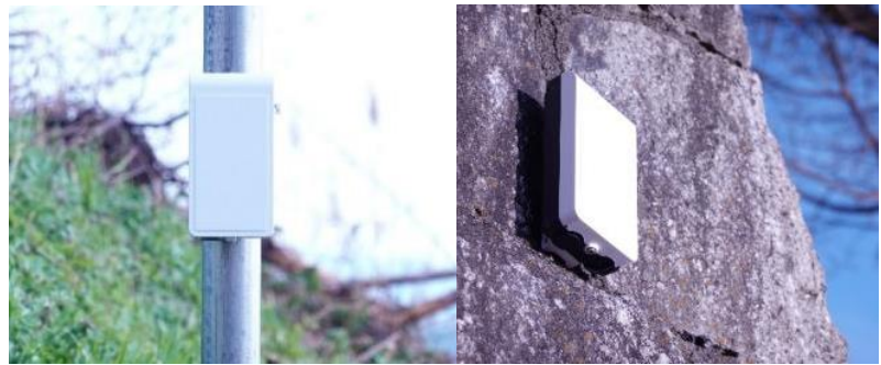
設備や土地の傾きを検知し情報発信