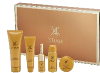
エクスリュクス スキンケアお試しセット