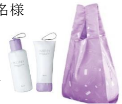
オリジナルエコバッグ