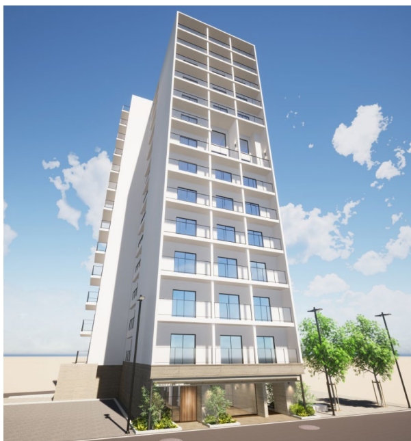
アルテシモ西早稲田（仮称）イメージ画像 （掲載の完成予想図は図面をもとに描いたもので 実際のものとは多少異なります）

< 当社の ESG への取り組みについて > https://www.global-link-m.com/company/sustainability/