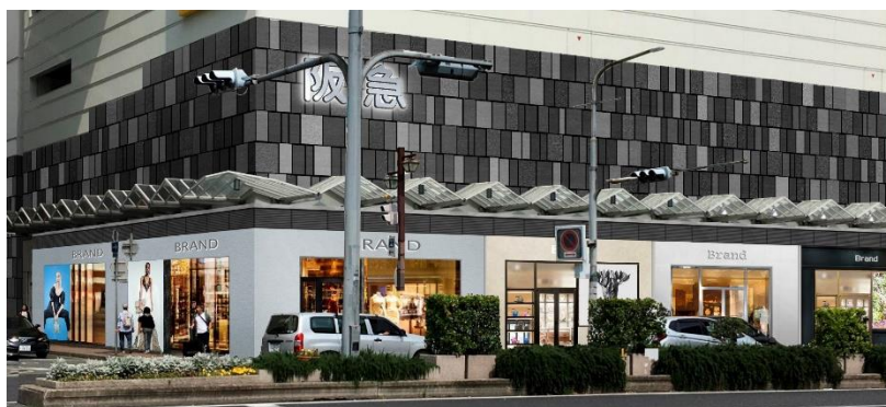
新館 1 階 外観

異なる要素をミックスし 1 つにすることで生まれる新しいモードな体験により、心躍る豊かな日常を提供する、約 2,500 ㎡の売場が 8 月 31 日に誕生します。本館とは独立した環境で、ファッションだけでなく、インテリア、カフェなど、「モード」を暮らしのアクセントとして取り入れる神戸流モードライフを提案します。