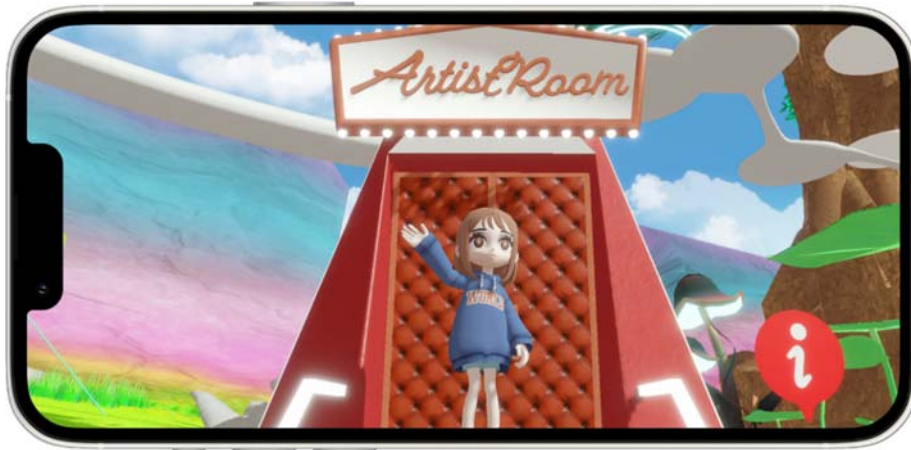
NeoMeパークにあるアーティストルームの入口イメージ。

NeoMe Liveに出演するパフォーマー専用のアーティストルームでは、動画やディスコグラフィの展示、フォトスポットでの撮影が楽しめます。