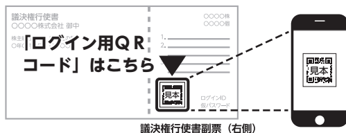
議決権行使書副票 (右側)