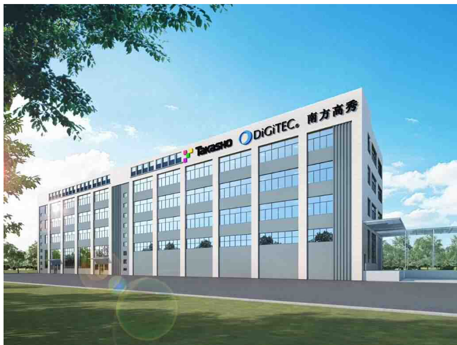
新工場イメージパース

さらに、現在の社宅棟（3 階建て）の全面改装及び、食堂の改装などにも設備投資をおこない、さらなる労働環境の向上を推進します。