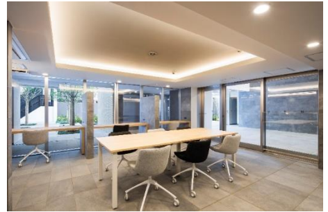
左：水盤のあるシーズンガーデン 右上：コワーキングスペース 右下：屋上緑化（※1）

また、環境共生型マンションとして光、風、水、植栽などの自然エネルギーを活用しながら、快適で心地よい住環境を構築するパッシブデザインの思想に基づき、植栽・水盤・住棟の配置をプランニングしており、敷地内に配した水盤や植栽が直射日光による建物への蓄熱を抑制し、心地よい風が循環する住空間を創出しています。水素と酸素を化学反応させて電気と熱をつくり出す、安全で環境にやさしいマンション向けエネファームを全戸に導入し、「低炭素建築物認定」及びBELS認証最高の5つ星を取得しました。当社は今後もSDGsの達成に向けた1つの施策として、住まいの消費エネルギーを削減し、地球温暖化防止など、省エネを意識した基本性能の高い住まいづくりに取り組んでまいります。