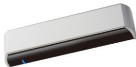
ビーコン内蔵 自動ドアメディアセンサー OAB-215V