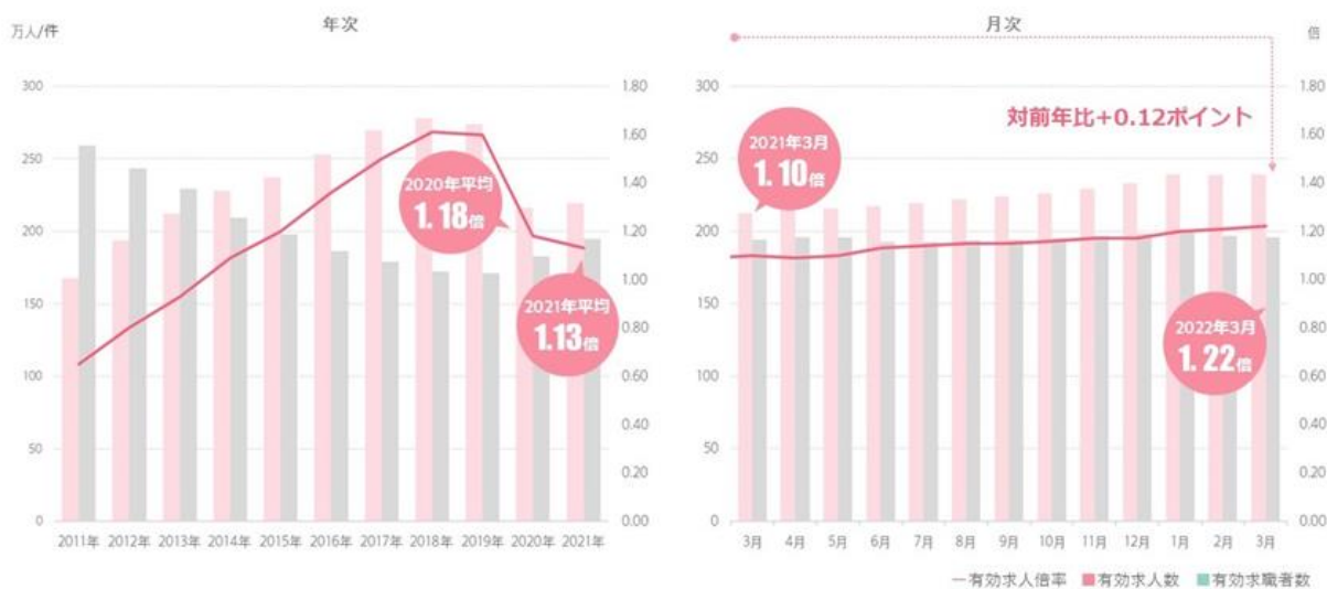
求人倍率① 求人・求職及び求人倍率の推移（全国/季節調整値）/3月

2022年3月度の有効求人倍率（季節調整値）は1.22倍。前月+0.01ポイント、前年+0.12ポイント改善しました。2022年に入り一気に改善し、2月3月と微増傾向が続いています。パートのみの求人倍率（季節調整値）は1.21倍。正社員の有効求人倍率（季節調整値）は0.94倍。