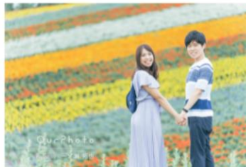
思い出の花畑を背景に私服でカップルフォト