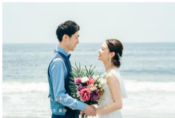
海辺で初夏のロケーションフォト