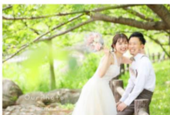
結婚式前撮りでブーケ&ドレス