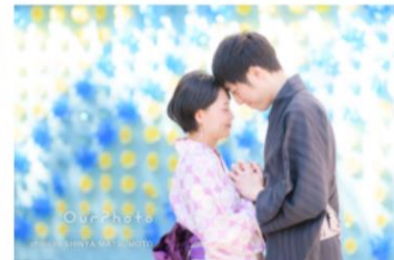
特別な浴衣デートの記念にカップルフォト