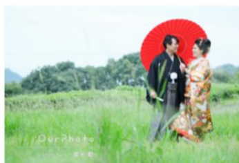
色打掛と袴の和装婚礼フォト