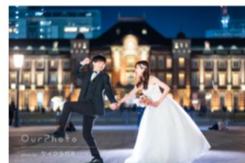
街中で夜景が綺麗な結婚式前撮り