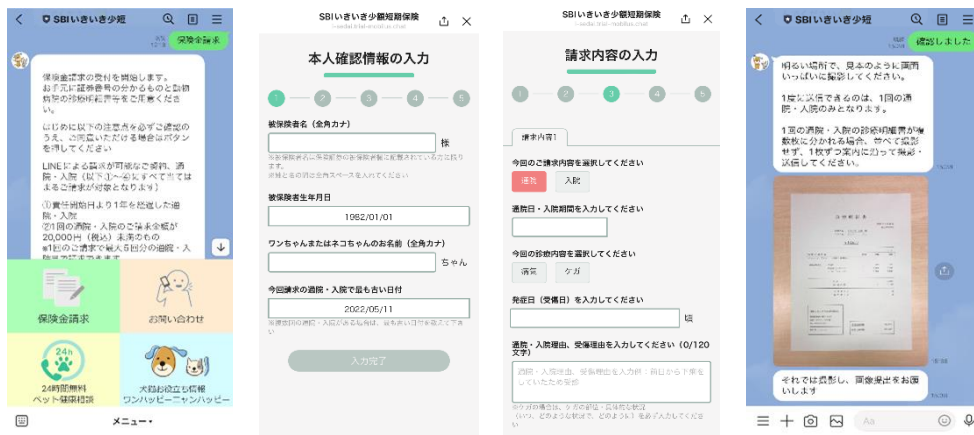
図1 「LINE 公式アカウント上での保険金請求手続き」イメージ画面

本サービスは、チャットボット「MOBI BOT」、有人チャットシステム「MOBI AGENT」と顧客管理システム「Salesforce」を連携することにより、「LINE 公式アカウント上での保険金請求手続き」および「本人確認・契約内容確認の自動化」を実現します。