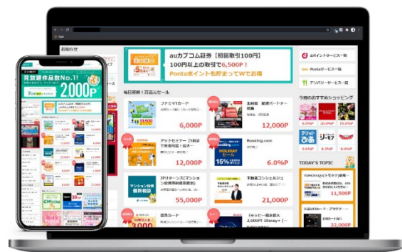
モッピーのトップページ