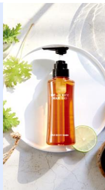
me_more MARUKO シリーズ