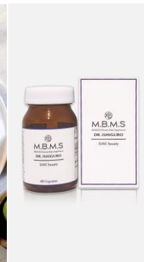
健康食品及び サプリメント