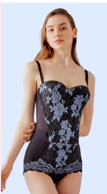
デコルテ リュミエス シリーズ