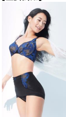
カーヴィシャス シリーズ