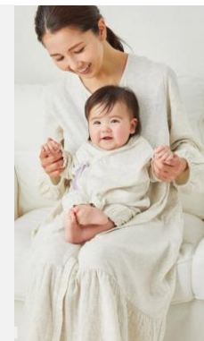
マタニティ& ベビーウェア