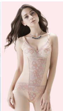
ベルアージュアヴァンセ サクラシリーズ