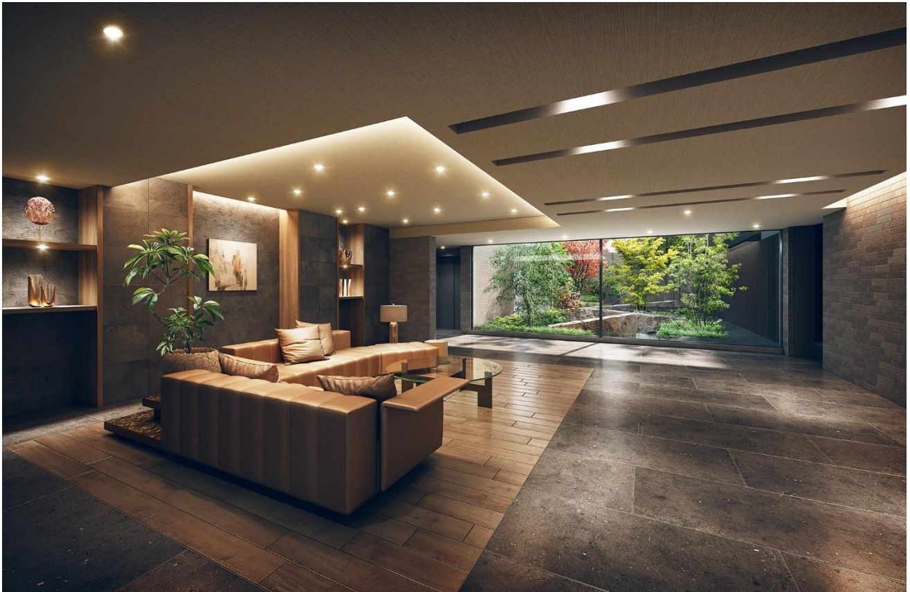
左上：エントランス完成予想図 右上：中庭完成予想図 下段：エントランスホール完成予想図 (※2)