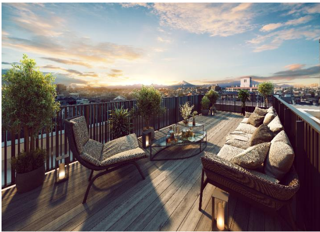
屋上テラス完成予想図 B3タイプ (※5)