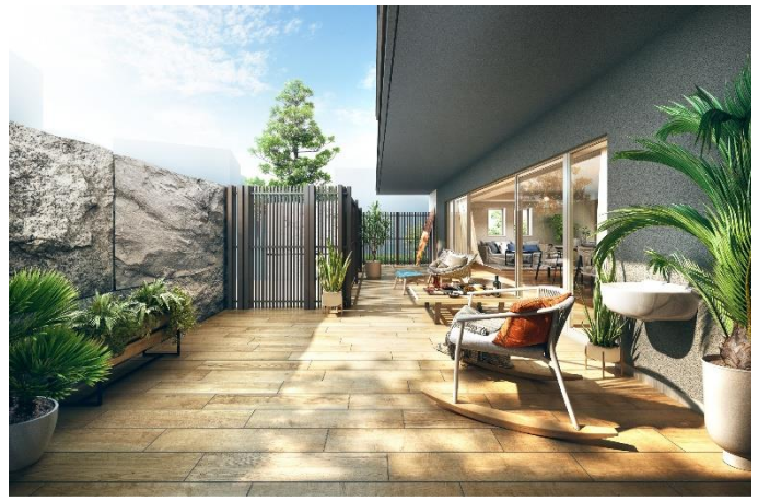
テラス完成予想図 A1タイプ (※2)