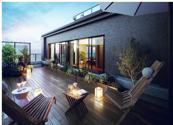
ルーフバルコニー（P タイプ）完成予想図 (※1)