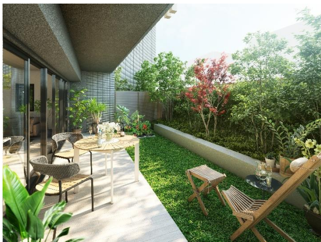
専用庭（C2 タイプ）完成予想図 (※1)