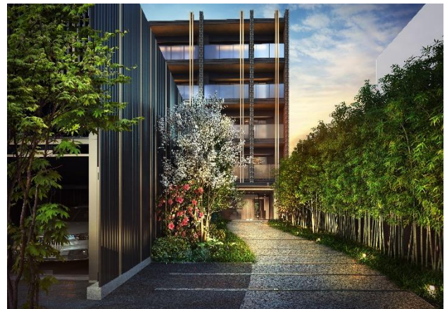
エントランスアプローチ（前庭）完成予想図（※1）