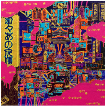
「サイバー浮世絵 東京夜景」