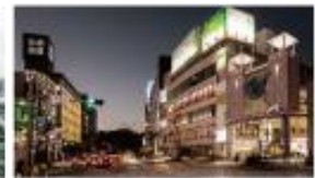
電車通り 徒歩 3min (約220m)