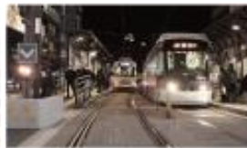
「通町筋」電停 徒歩 3min (約220m)