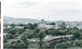
熊本城 徒歩 4min (約310m)