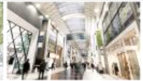
「上通アーケード」隣接 徒歩 1min (約30m)