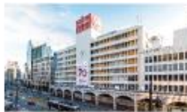
鶴屋百貨店 徒歩 4min (約280m)