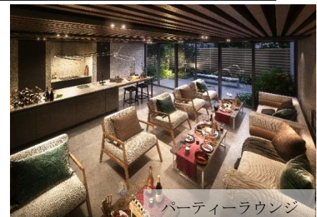
パーティーラウンジ

旧くから中心であり続ける地の記憶に敬意を払い、16 本の大楠が並ぶオークス通りに面するレジデンスとして。敷地の内側となる領域に洗練された空間を創出。通りに対して閉鎖的にするのではなく、開放的な外構計画とすることで樹々の彩りとともに私邸へと誘い、住まう方の誇りとなる迎賓の設えをデザインしました。