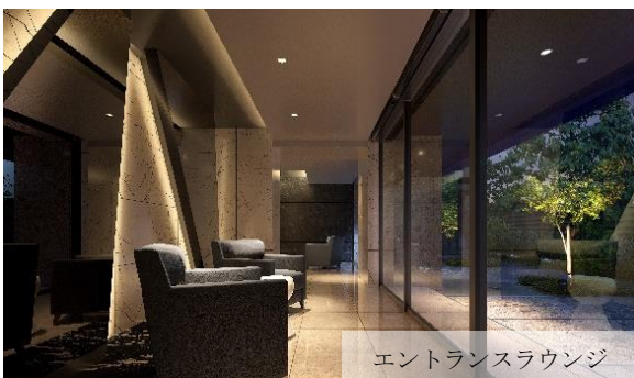
エントランスラウンジ