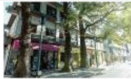
オークス通り 徒歩 1min (約10m)

悠然と聳える熊本城に見守られ、「電車通り」に灯る電停の明かり。豊かな時を重ね、輝きを増す百年の光が、熊本の誇りを照らし続ける。