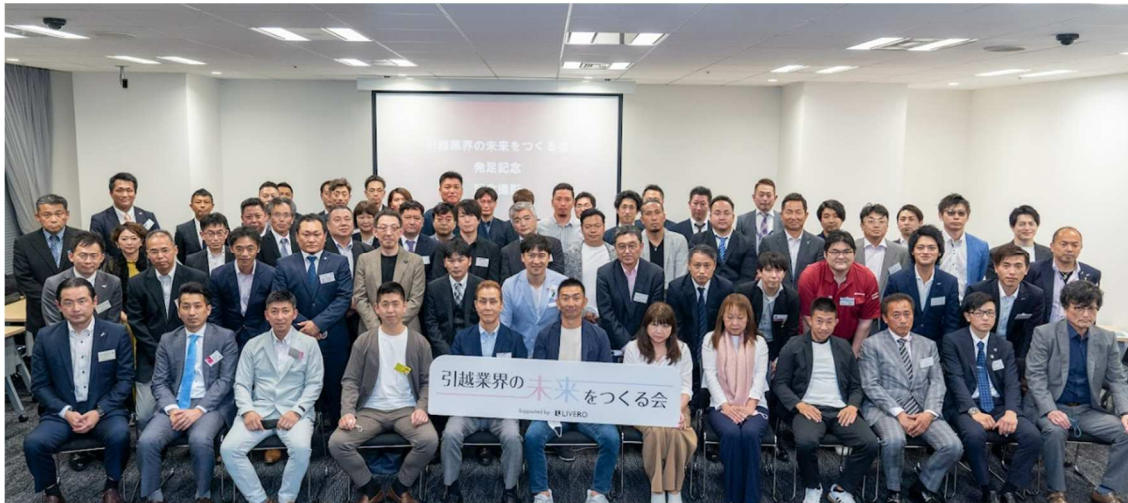
(「引越業界の未来をつくる会」発足式の様子)

— 課題解決をサービス開発と場の提供で支援、「働きたい」と言われる業界を目指す —