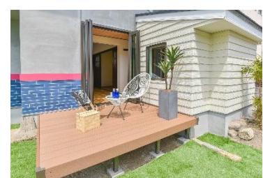
【ウッドデッキ(建物東側)】