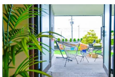
【リビング・土間から見たカバードポーチ】