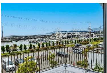
【ベランダからの眺望】

本物件は垂水駅より徒歩5分の地にあり、眼前に海が広がる立地が特長です。南側にあるベランダやカバードポーチからは垂水漁港が望めます。休日にはより穏やかな時間を過ごしていただけるよう、ウッドデッキの設置や人工芝を施工いたしました。