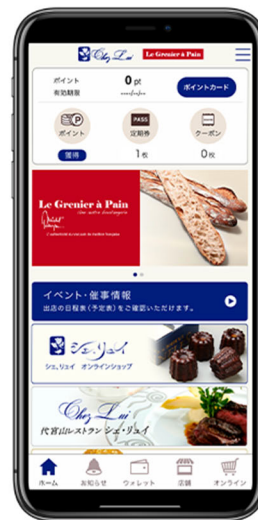
図1 『ガストロノミー公式アプリ』アイコンとトップ画面