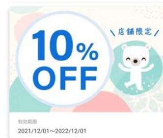
〔クーポンイメージ〕